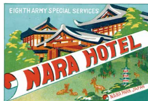
昭和 20 年～昭和 27 年 (1945 ~ 1952) ※米軍接收