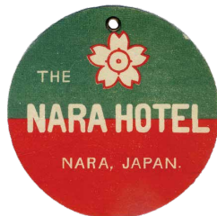
明治 42 年～大正 2 年 (1909 ~ 1913)