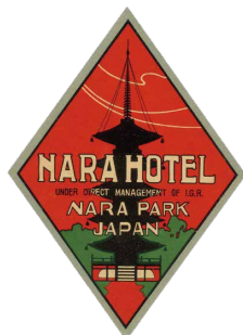
大正 2 年～大正 9 年 (1913 ~ 1920)