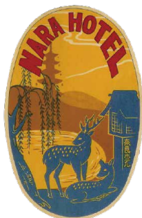
昭和 27 年～昭和 31 年 (1952 ~ 1956)