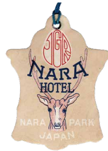
大正 2 年～昭和 20 年 (1920 ~ 1945)