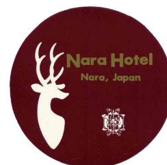
昭和 58 年～ (1983 ~)

JR 西日本ホテルズは、持続可能な開発目標 (SDGs) を持ち、地域と共に、お客様一人ひとりの豊かな人生を広げます。今回ご案内の取り組みは、SDGs 目標の 1 番、3 番、11 番、13 番、17 番に貢献するものと考えています。