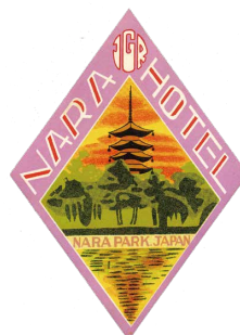
大正 2 年～昭和 20 年 (1920 ~ 1945)